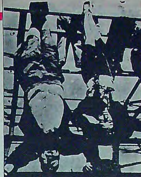
BİR GÜN ELBET HESAP SORULUR: İtalyan halkı faşist kâtil Mussolini'den işe böyle hesap sordu.

MHP ve yandaşlarının "toprak reformundan yanayız, toprak ağalarına karşıyız" sözleri de halkı aldatmak için, köylüleri de bu yalanla kandırmak için kullanılan demagojinin bir parçasıdır. Niye mi? Çünkü Ülkü Ocaklarına ve MHP'ye bağlı faşistler, Urfa'da toprak ağalarının arazilerini talim yapıp, köylü köylülere saldırmıyorlar, ağaların topraklarını koruyorlar. Zaten toprak ağaları, yoksul topraksız köylülere toprak vermezler. İki kırbaçlı ağadan yoksul köylüye toprak vermesini beklemez, iyimserlik değilse, aptallık. İşte toprak reformundan yana olduğunu söyleyen MHP'lerden, üstelikte en önde gelenleri Cengiz Gökçek, MHP'li bir bakan, içişin ve yoksul köylünün hakkını savunduklarını söyleyen bir yandaştır. Çünkü, Cengiz Gökçek, topraklarını Ülkü Ocaklarının kişisi haline getiren, eli kırbaçlı bir toprak ağasıdır. Antep'in büyük